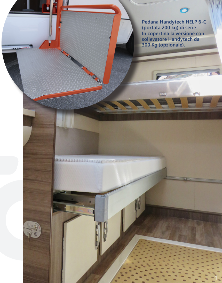
Pedana Handytech HELP 6-C (portata 200 kg) di serie. In copertina la versione con sollevatore Handytech da 300 Kg (opzionale).