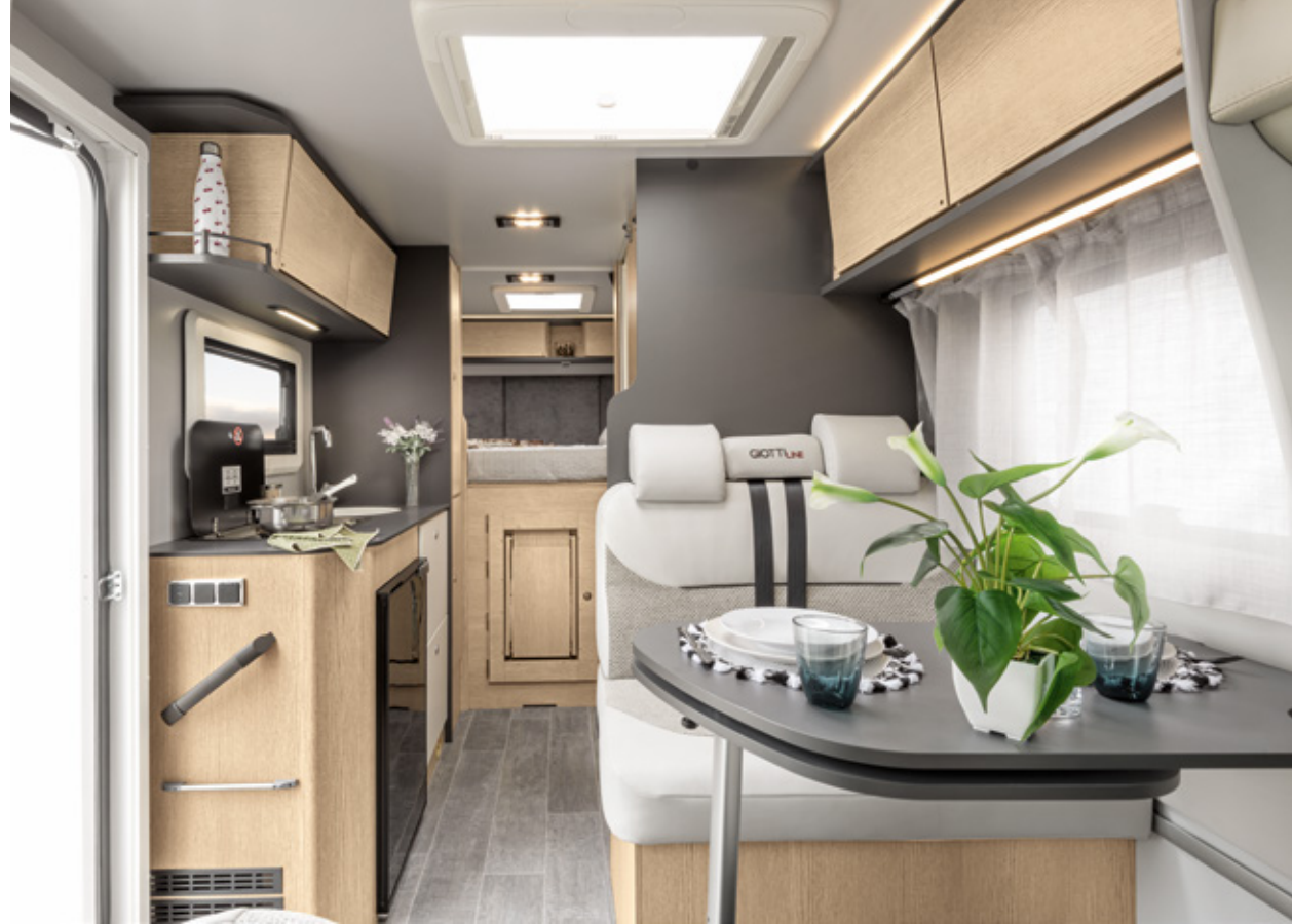
Tapiceria . Upholstery . Sellerie . Polsterung . Tappezzeria: STD

*Tapiceria . Upholstery . Sellerie . Polsterung . Tappezzeria: STD